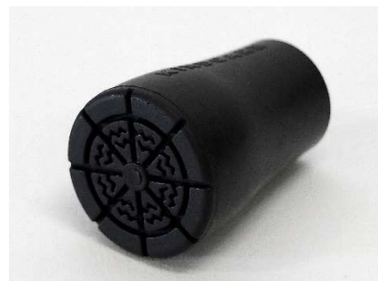
杖先ゴム Elxi(エリクシ)